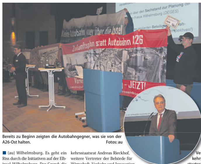
Bereits zu Beginn zeigten die Autobahnegner, was sie von der A26-Ost halten.

■ (au) Wilhelmsburg. Es geht ein Riss durch die Initiativen auf der Elbinsel Wilhelmsburg. Der Grund: die A26-Ost, neuerdings auch Hafenspange genannt, vielen besser bekannt als sogenannte Hafenerspange. Wie auch immer die geplante Autobahn genannt wird, sie sorgt für reichlich Zündstoff und Emotionen. Wie das aussieht, wurde besonders deutlich am vergangenen Mittwochabend im Bürgerhaus Wilhelmsburg. Von Verrat am Stadtteil war die Rede, Buhrufe nicht selten, aber ebenso frenetischer Applaus und emotionale Reden. Das Projekt „Perspektiven! Miteinander planen für die Elbinseln“ hatte eingeladen, um über das von Perspektiven! durchgeführte Bürgerbeteiligungsverfahren zum letzten Abschnitt 6c der A26-Ost zu informieren. Desweiteren waren Ver-