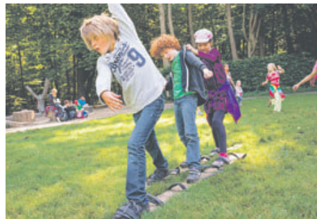
Ein großer Spaß für die Kleinen: Eine Rallye durch den Wald, organisiert von der Schutzgemeinschaft Deutscher Wald.

Die SDW organisiert den Tag im Wald, baut die Stationen auf und sorgt sich um den reibungslosen Ablauf. Die Stationen werden durch ehrenamtliche Helfer und Helferinnen