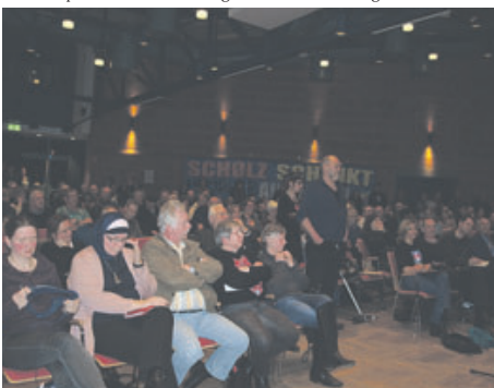
Rund 350 Bürgerinnen und Bürger waren zur Informationsveranstaltung ins Bürgerhaus gekommen.

füllt werden. Wir wollen, dass die Planung besser wird. Wir wollen ein Beteiligungsverfahren durchführen, das vielen Menschen die Möglichkeit gibt, mitzugestalten. Dafür haben wir ein Verfahren entwickelt, das eine Reihe von unterschiedlichen Beteiligungsmöglichkeiten bietet und als Bürger-Gutachten in das Planfeststellungsverfahren einfließt. Beide Ansätze, der des Bündnis Verkehrswege Hamburg und der von Perspektiven! sind Teile des demokratischen Prozesses. Wir setzen uns niemandem auf den Schoß, sondern zwischen alle Stühle. Wir ergreifen weder Partei für, noch gegen eine neue Autobahn. Wir ergreifen Partei für das bestmögliche Beteiligungsverfahren im Rahmen der politischen Beschlusslage. Wir machen keine Werbung für Autobahnen. Wir machen Werbung für Demokratie“, so Kiehn. Das Bürgerbeteiligungsverfahren, das die Initiativen übrigens ablehnen, ist am vergangenen Donnerstag mit einer Onlinebeteiligung (bis 31. März) auf www.A26.perspektiven-elbinseln.de gestartet.