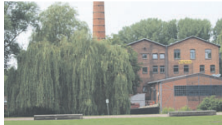
Die Honigfabrik und die Geschichtswerkstatt Wilhelmsburg erhalten mehr Geld.

beschlossen, die Projektmittel im Bereich der Stadtteilkultur im Jahr 2017 aus bezirklichen Mitteln um 18.000 Euro zu erhöhen. Insgesamt stehen der Stadtteilkultur im Bezirk somit 79.000 Euro mehr als im Vorjahr zur Verfügung. Im Jahr 2018 wird die Rahmenezuweisung durch