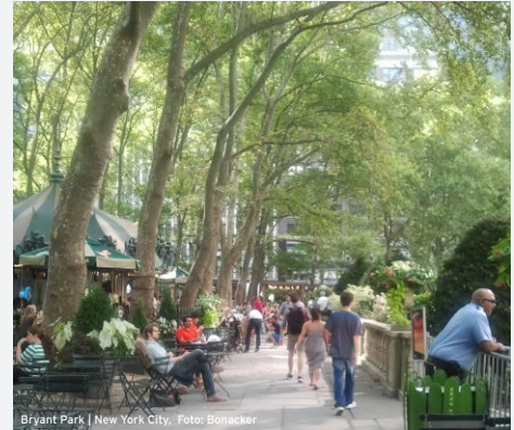
Bryant Park | New York City

Im Anschluss besteht die Möglichkeit zum informellen Austausch auf der Restaurantterrasse mit Blick auf die Elbe!